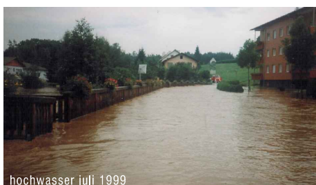
hochwasser juli 1999