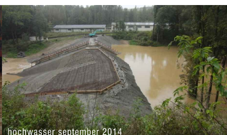
hochwasser september 2014